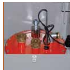
Trou d'homme d'inspection